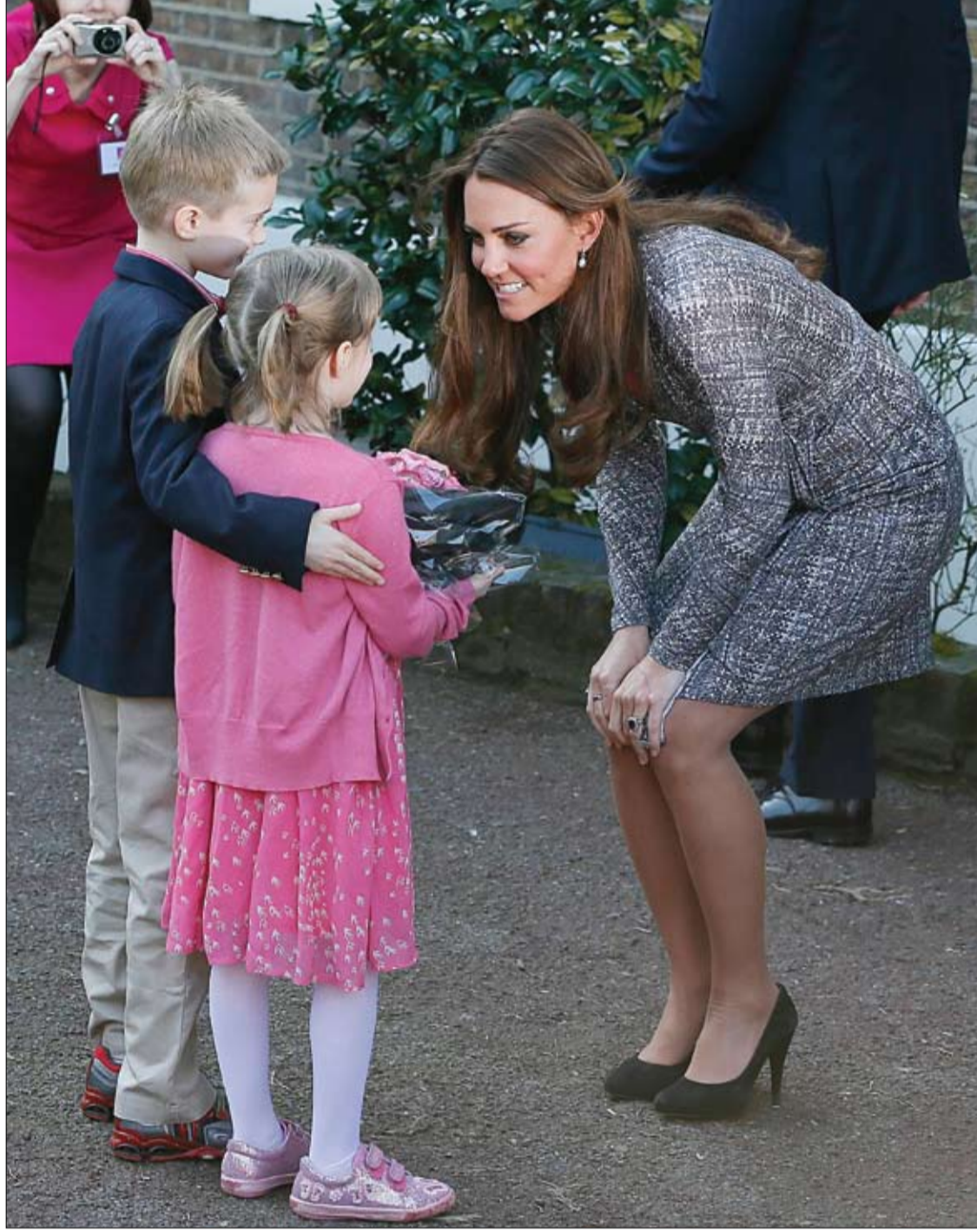
كاترين دوقة كامبريدج تتلقى الزهور من الأطفال خلال مغادرتها مركز الأمل لعلاج الإدمان في لندن.

كما سلطت المجلة في بحثها أيضا الضوء على اختلاف الساعة البيولوجية بين البشر حسب كل موظف ومهنته، وعلاقة ذلك بالجدول الزمني لساعات النوم والاستيقاظ.